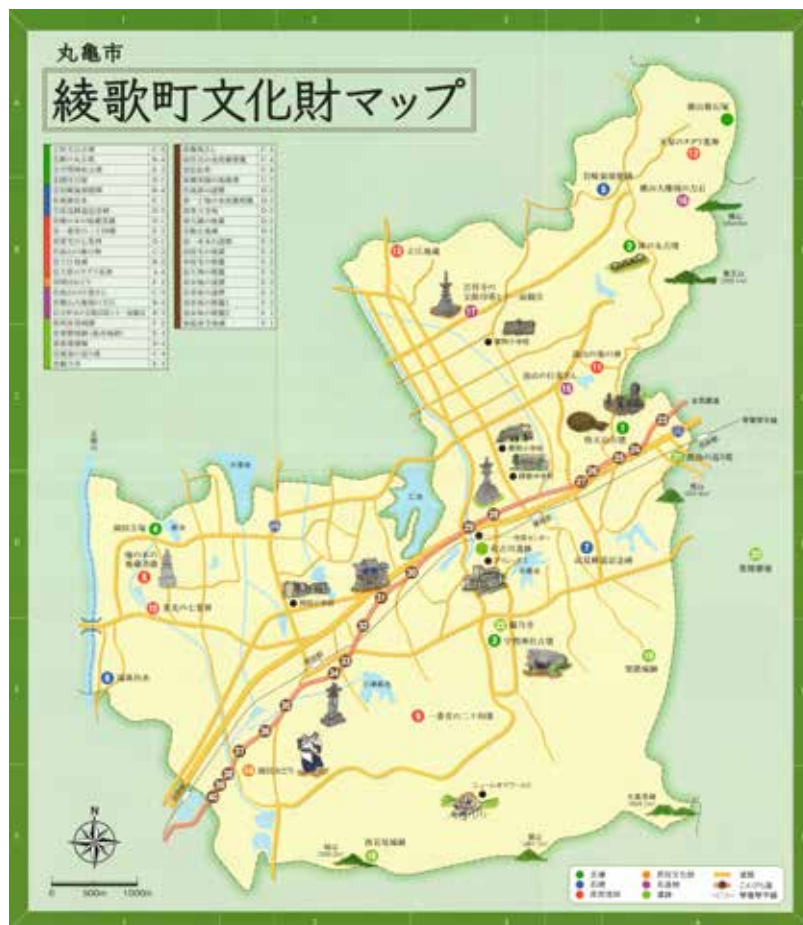
図 33 丸亀市綾歌町文化財マップ

史跡等の文化遺産は丸亀市の隣接自治体にも広範に所在し、その活用についても様々な取り組みが実践されている。そうした他の自治体、例えば香川県立ミュージアム、香川県埋蔵文化財センター、隣接の市・町の教育委員会などと広域的な連携を行い、事業を実施したり、史跡の公開・活用の方法を検討したり、人的な交流や情報発信に取り組むことで、効果的で内容性を高めた活用を図っていく。