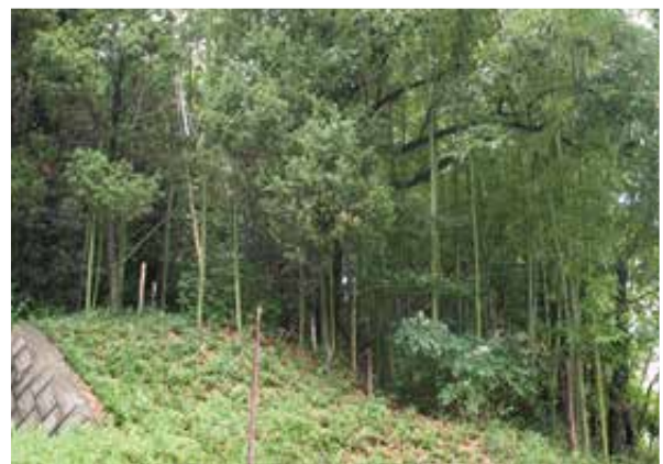
2 整備計画地南東部竹林