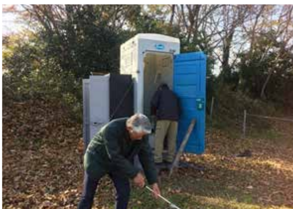
1 施設の維持管理（快天山古墳を守る会）

また、地元のNPO（特定非営利活動法人あやうた）や保存会（快天山古墳を守る会）などと協力し、今後も引き続き行政と市民が協働しながら連携を深めていく。