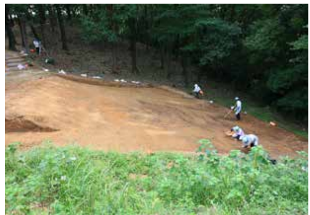
2 調査風景（平成 29 年度）