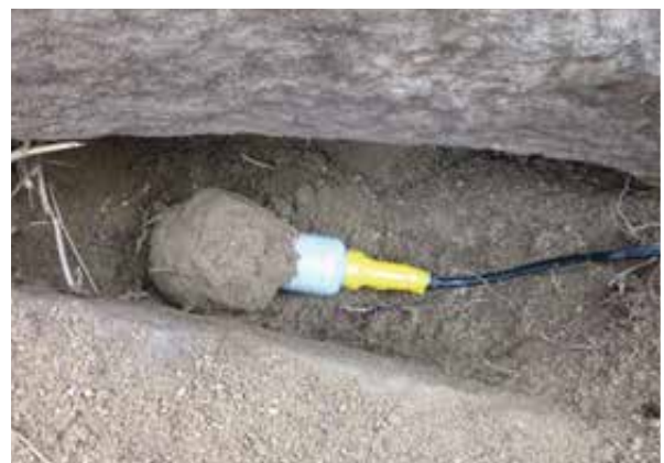
4 第1号石棺内水分計設置状況