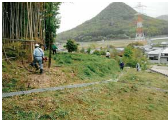
4 草刈（特定非営利活動法人あやうた）