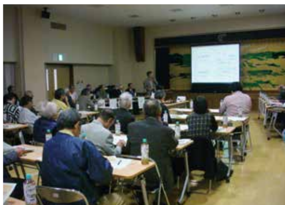
2 講演会の開催（快天山古墳を守る会）