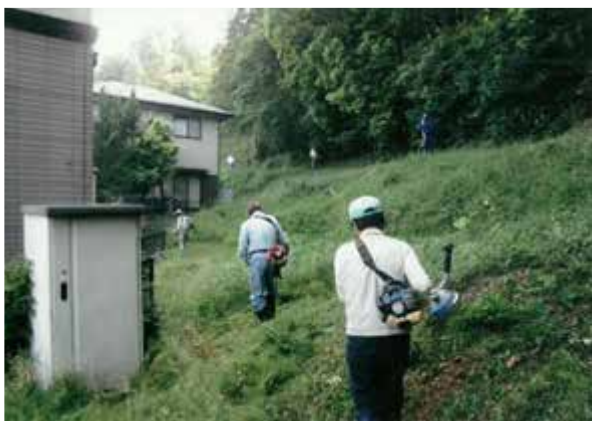
3 草刈（特定非営利活動法人あやうた）