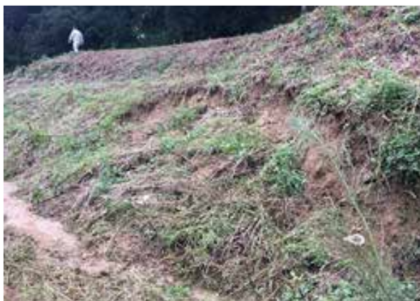
1 整備計画地東部急斜面部

評価は、三段階で行い、現状、目的、成果等を記載する。経過観察の評価は、チェックシートに基づき、当保存整備委員会をはじめ、関係部局などから意見を聴取し、整備基本計画作成につなげていく。