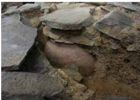
3 平成29年度近世墓検出状況（有雅墓下）