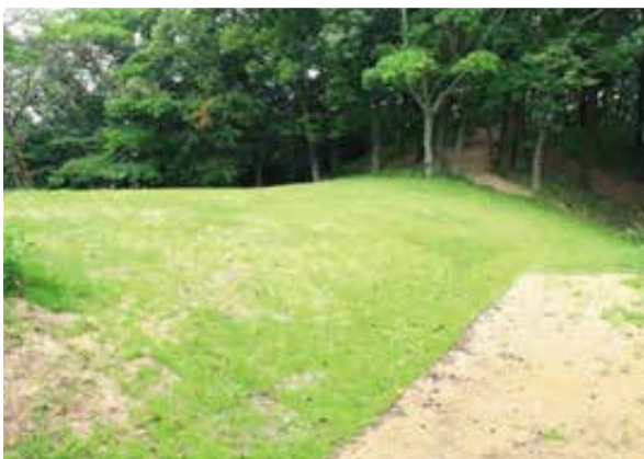
1 盛土・芝張による墳丘養生