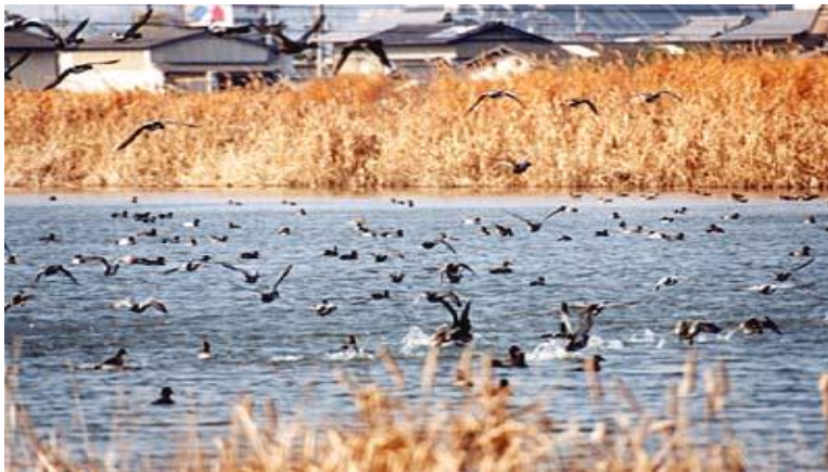
たいいけ 太井池の水鳥