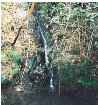
ことがたき 琴ヶ滝

「琴ヶ滝」は、綾歌町の南部に位置する森林公園のほぼ中央にあり、美しいヒノキの林の中で神秘的な趣を呈しています。この滝は、長さが約 100m あり、猫谷池を経て、中大東川へ流入しています。岡田甚句集の名所古蹟ずくしでは「愛宕の滝と銚子滝。雄滝雌滝の琴ヶ滝」と謡われ、古くから景勝地として語り継がれています。