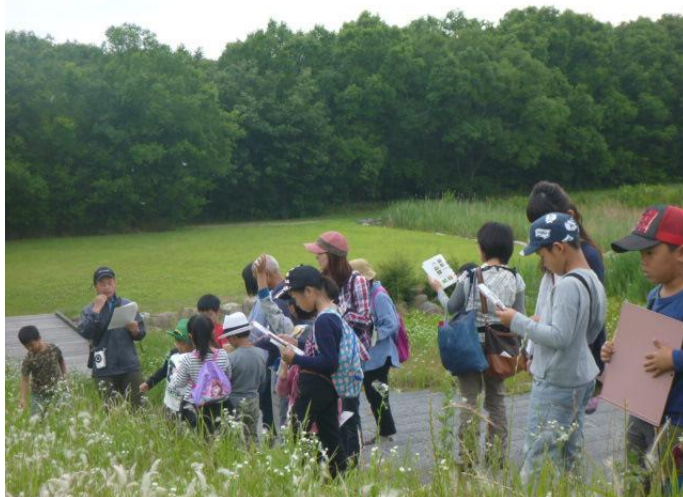
土器川生物公園での自然観察会

市民アンケート調査などによると、自然環境に対する意識は中心部に丸亀城（亀山公園）があることなどから、「自然環境が豊かである」と感じている人が多いです。また、将来の丸亀市の姿として、「河川や森林などが適正に管理され、自然環境が良好に保たれている」といった自然環境の保全に対する関心が高いです。全ての市民が、普段の生活において身近に自然を感じられるような施策を進め、「豊かな自然と身近にふれあえるまち」を目指します。