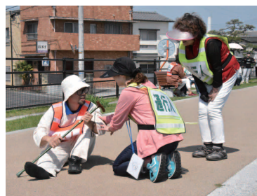
困っている人を見かけたら 声を掛ける取り組み 「認知症SOSネットワーク模擬訓練」

3年前から健康ポイント制度が始まり、行事に参加する人が増えました。3人に声を掛けられたら1ポイントもらえるので、行事があるときには近所の人など30人ぐらいに声を掛けています。声を掛けると参加してくれる人が多く、来てくれると私自身もうれしくなります。これからも人との輪を広げていければと思います。