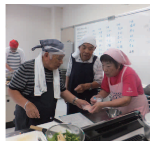
男性も楽しんでいる料理教室