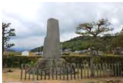
岡田久次郎顕彰碑

現在も毎年、久次郎の業績を称え亀越池土地改良区の人たちにより法会を行い、その功績を語り継いでいます。