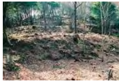
西長尾城跡の連郭式曲輪列