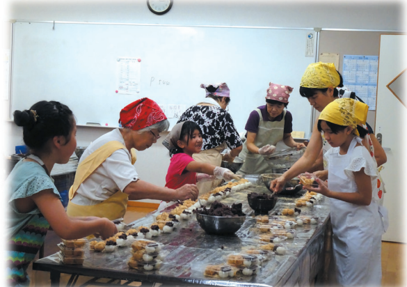
団子づくり（月見の会）