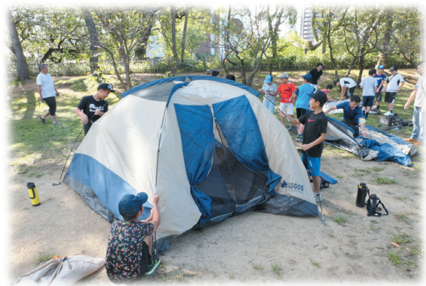
丸亀城内でミニキャンプ（城西小6年生対象）