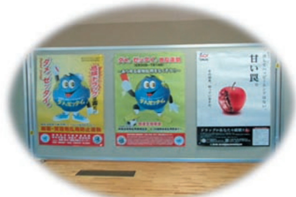
ポスター展(城西まつり)