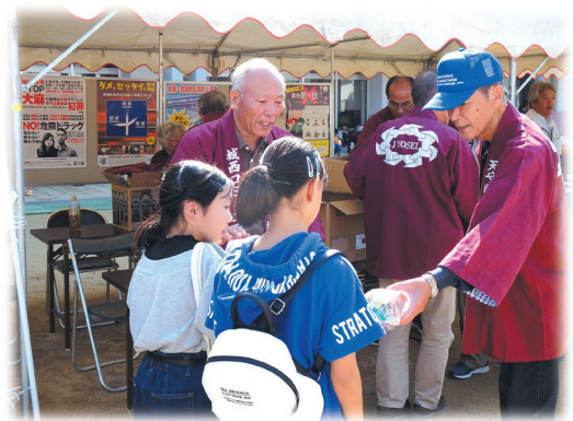
人権・薬物撲滅運動のポスター展 (城西まつり)

また、コミュニティ行事に積極的に参加しながら人権・薬物撲滅運動に関するリーフレットを配布し、協力する中で仲間づくりと絆づくりを実践している。