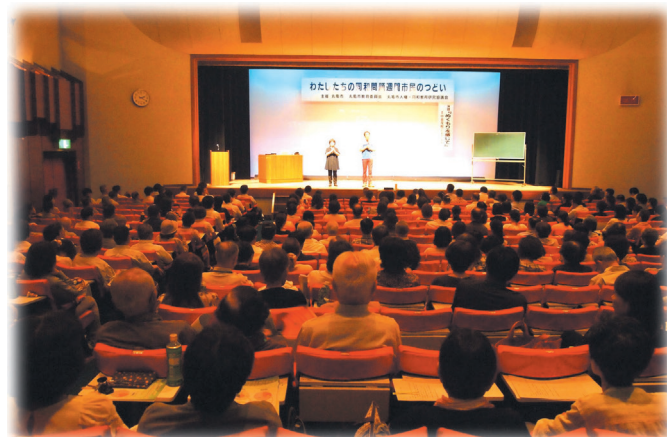
同和問題週間市民のつどい