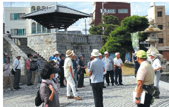
ファミリーウォーク