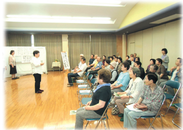
詐欺防止の寸劇（男女共同参画セミナー）

市の男女共同参画セミナーを活用し、出前講座や講演会を通し男女が共に参画しやすいコミュニティ活動を目指している。