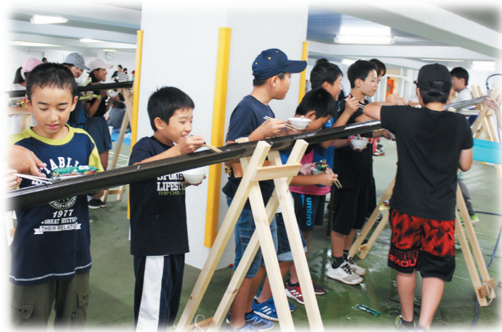
そーめん流し（ミニキャンプ）