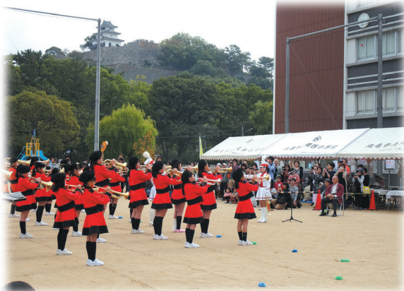
城西小マーチングバンド（城西まつり）