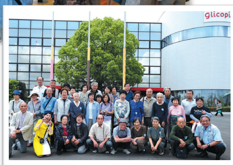
グリコピア神戸(バスハイク)