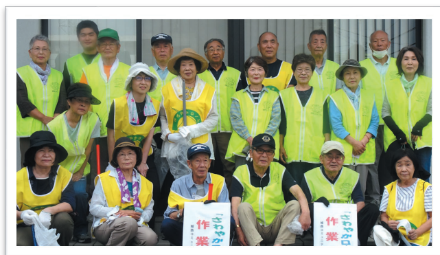
さわやかロード実施