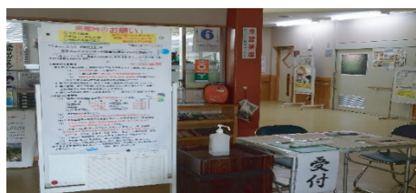
新型コロナウイルスの感染 拡大予防の注意事項（掲載）