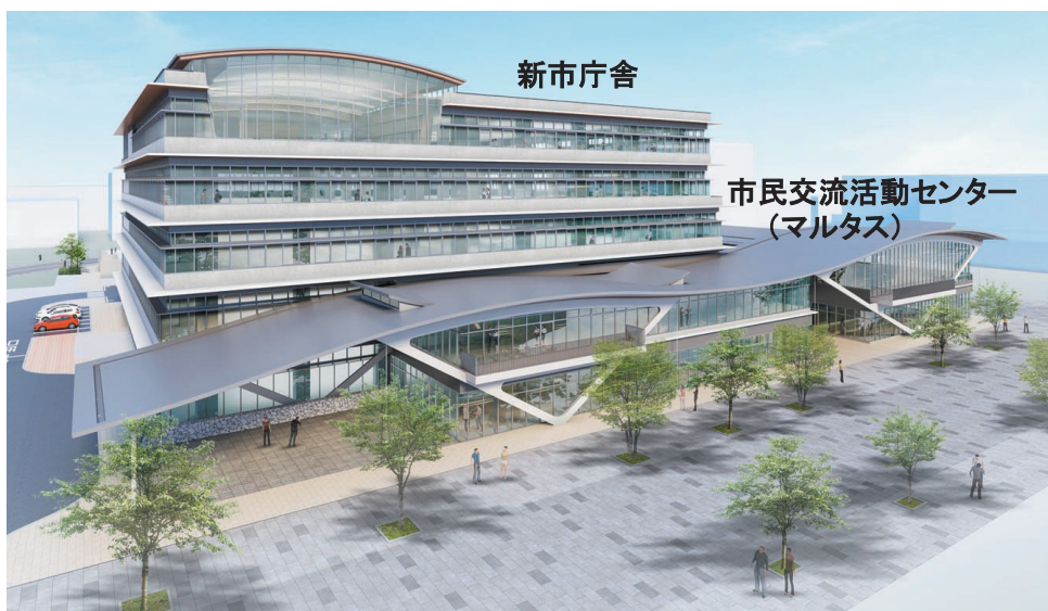
新丸亀市役所 イメージパース（開庁予定時期令和3年3月）

アイ眼科・中山病院・篠原記念病院・中山クリニック・須崎内科医院・広瀬整形外科医院・おおつか内科医院・まるがめ医療センター・香川労災病院・丸亀メンタルクリニックソフィア・サンテペアーレクリニック・藤本歯科医院・末森元歯科医院・片山歯科医院・篠原歯科医院