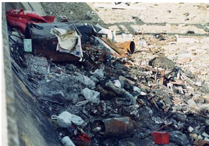
金倉川の不法投棄

推進会議では、金倉川の環境美化及び環境保全を図るための連絡・調整や具体的なあり方に関する事、河川愛護意識の普及・啓発に関する事、流域環境調査や定期的なパトロール調査によるごみの不法投棄等の防止とその対策に関する事などについて取り組んでいます。