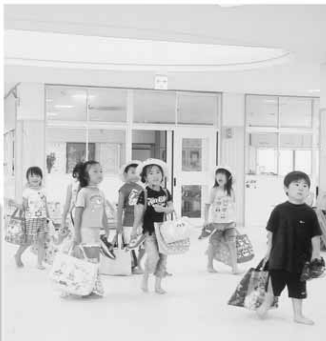
子どもの健やかな成長を見守ります

○学校内外における不審者対策及び把握状況。 ○岡田小学校運動場整備事業の内容。 ○幼稚園預かり保育事業を全市的に広げていく考え。 ○綾歌・飯山町に設定している幼稚園の通園区の検討状況。 ○西中学校校舎改築事業での検討委員会設置内容。 ●主要要望 ○敬老会へ参加しやすくなるような施策の発想転換をしていたきたい。 ○学校施設の夜間照明代については、有料化することも含め市民の意見を聞いていただきたい。