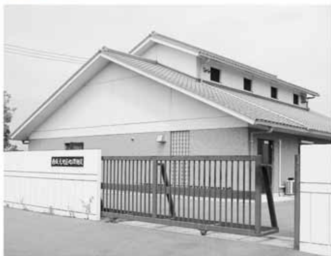
農業集落排水事業 西坂元地区処理施設

の計画及び最終処分場の計画。 ○合併後の飯山町と綾歌町の農業集落排水事業の整備構想。 ○街路樹の剪定、管理に対する考え方。 ○市民広場及び公園整備計画。 ○携帯一九番通報直接受診システムの内容。 ○救急救命士教育訓練事業負担金の内容。 ●主要要望 ○フルーツの男づくり推進事業は、検討委員会を持って広く意見を聞き、充実したものにしていただきたい。 ○合併を機に各まつりの名称変更も含めて全庁的に検討してい