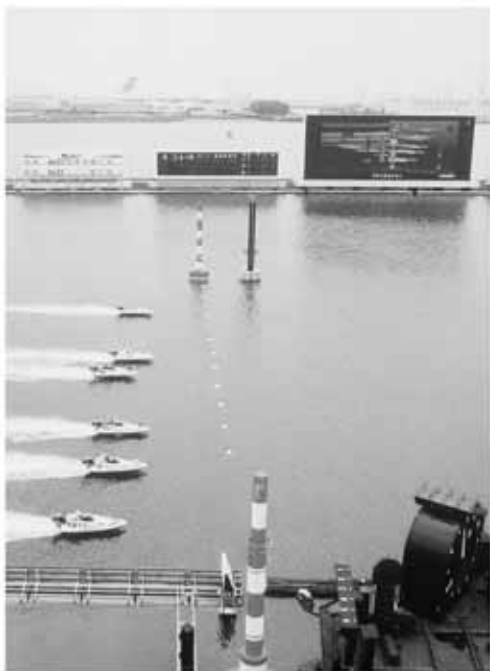
「G1京極賞開設53周年記念競争」を開催 9月14日からぜひお越しください