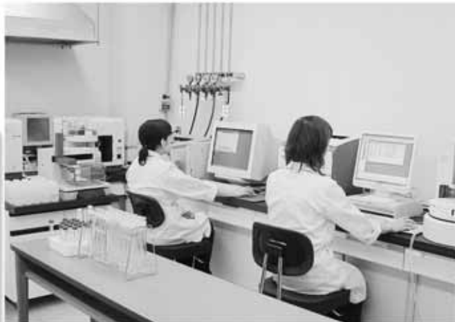
安全な水を市民のみなさんへ提供します