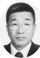
27 香川おさむ 謹賀新年 丸亀市が調和と均衡のとれた元気なまち

ますが、衆知を結集して明るい未来への展望を開いて参りたいと思います。本年もよろしくお願い申し上げます。