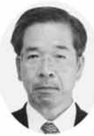
25 高橋 等 明けましておめでとうございます。今年も、新しいまちづくりに一生懸命頑張ります。まちづくりの基本は、一体感の醸成と調和ある発展。偏らない一体感を目指します。

今年も市民の皆様方と一緒に、安全で安心して暮らせるまちづくりを目指して、精一杯努力する所存です。