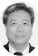
34 倉本 清一 明けましておめでとうございます。国会では、ねじれ現象で

議論伯仲です。問題は弱者が本当に笑って過ごせるようにすることです。今年も福祉向上のため頑張ります。