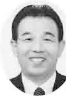
27 国方 功夫

迎春 昨年は政権が交代し政治・行政の手法が大きく変化してきています。地方も大きく変動されその力量が問われよう！私は引き続き頑張りますので、よろしく申し上げます。