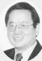
丸亀市議会議長 高木新仁