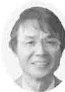
7 藤田 伸二

「いちばん近くで動く、働く」の公明党議員として、今年も駆けます！しゃべります!! 便利な市役所、議論の活発な議会を目指します。ホームページ「うちだ俊英」検索