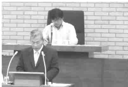
市長による議案の説明

1日は、まず議案第47号を審議し、採決の結果、原案を承認しました。続いて、議案第48号