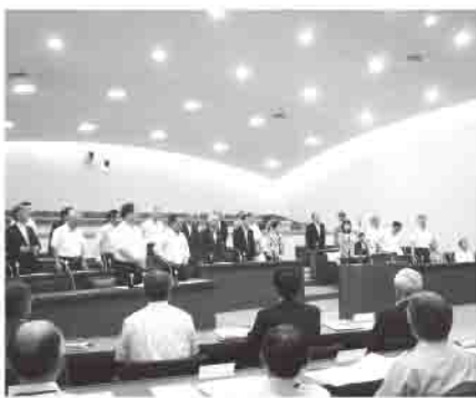
起立採決の結果、原案の通り可決

議案第53号・54号・55号・56号・57号は、「丸亀市議会の議決に付すべき契約及び財産の取得又は処分に関する条例」により、議会の議決を経なければならぬことになっていきます。