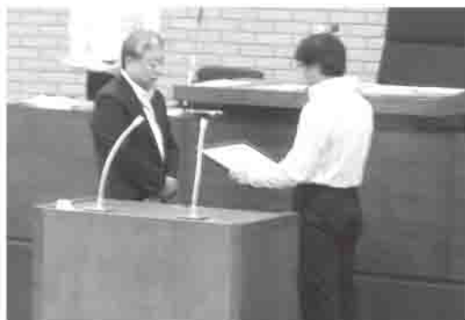
永年勤続表彰状の伝達