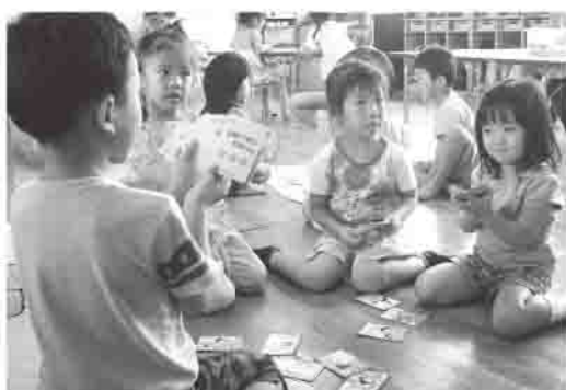
みんなで仲良くかるた遊び