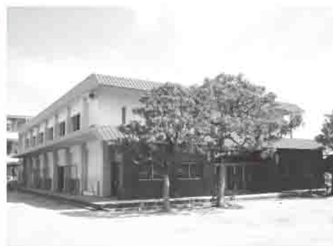
城南小学校屋内運動場