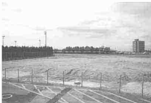
新丸亀警察署（仮称）建設予定地