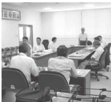
長崎市で説明を受ける

長崎市では「空き家対策」について研修し、所有者から寄付された建物と土地を除去や空き家除去費の一部を補助する事業の実施、そして空き家等の適正管理に関する条例を制定するなど、徹底した空き家対策に取り組んでいる。