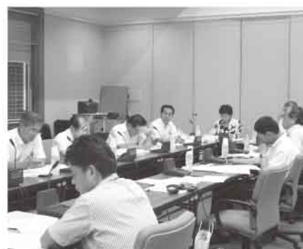
習志野市で説明を受ける

る意見や要望などを受け止め、姿勢に反映させるとともに、地域の行事や活動に直接参加し、地域に根付いたまちづくりを模索している。職員の意識改革にもつながる制度なので、ほぼ全職員が担当している。