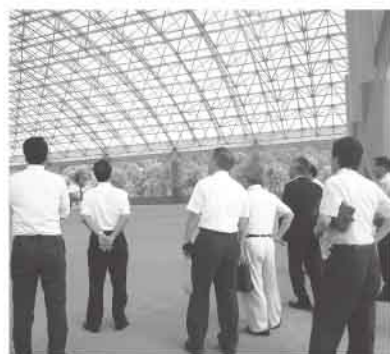
みゆき球場（嬉野市）