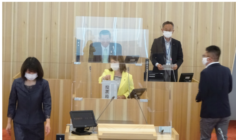
正副議長選挙の投票

また、中讃広域行政事務組合議会議員4名、香川県後期高齢者医療広域連合議会議員2名と香川県広域水道企業団議会議員2名の選挙を行いました。