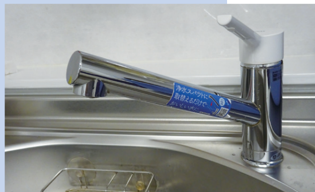
水は大切に使いましょう

新型コロナウイルス感染症対応地方創生臨時交付金を活用し、水道基本料金の無償化をしようか。光熱水費の中でも水道料金であれば、比較的少ない事務で広く市民生活を支援することができるのではないかと。水道基本料金を半年間無料にする場合、いくらかかるのか。また、問題点は。