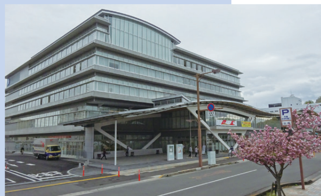
市職員の働き方改革を