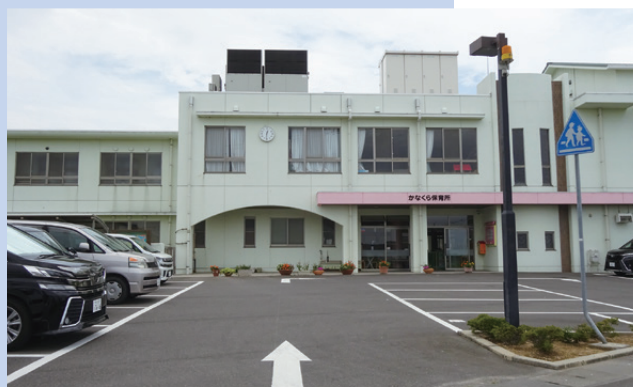
公立保育所での取り扱いは…

A 教育部長 子どもの健康状態を把握するため、本市の公立保育所では使用済みおむつを保護者が持ち帰っている。その一方で、県内では、4市町の公立園が施設での処理を行っている。