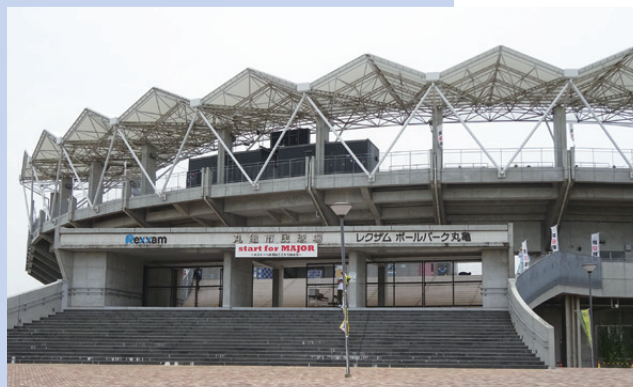
BP丸亀(丸亀市民球場)

A 市民生活部長 本格的な野球経験がない人に球場を利用してもらうことは、球場の利用率向上となるだけでなく、多くの市民に球場を認知してもらいう機会にもなるため、丸亀市民球場でもバッティングイベントの実施に向け、球場の指