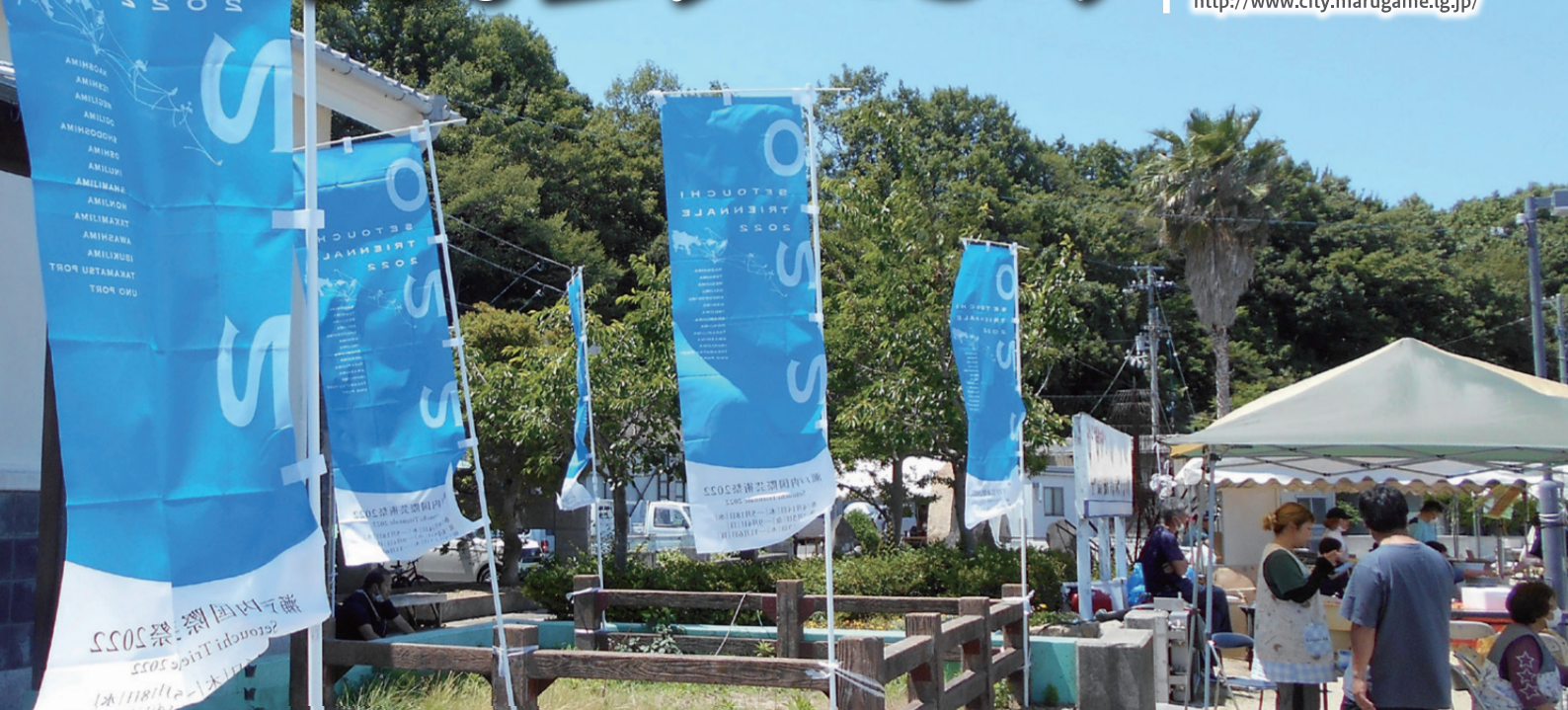
瀬戸内国際芸術祭2022本島会場スタートイベント 第2回本島タコタコフェスティバル

発行日 2022年(令和4年)8月1日 発行 丸亀市議会 編集 広報広聴委員会 TEL(24)8828 市ホームページ http://www.city.marugame.lg.jp/