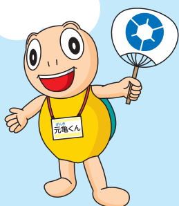
「健やか まるがめ21」 マスコットキャラクター 元亀(げんき)くん