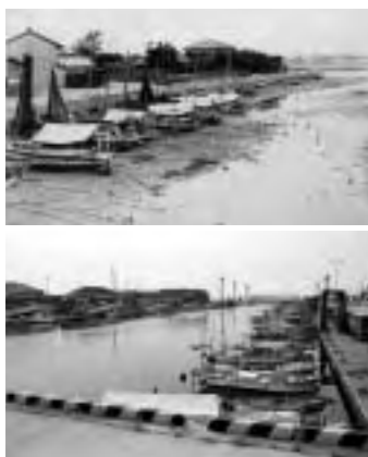
御供所町の昔と今