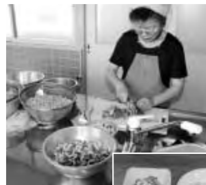
手際よく調理して

《あて先》〒763-8501丸亀市環境課「緑のカーテン」係 ☎24-8838、Eメール(kanryo-k@city.marugame.jp)でも受け付けます。