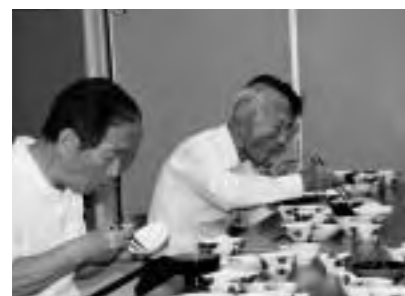
この苦味がいいんだね