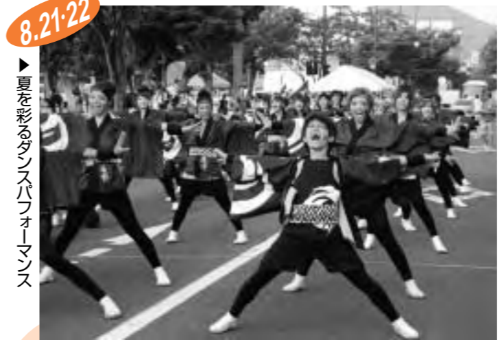
8.21・22 ▶夏を彩るダンスパフォーマンス

「婆娑羅まつり」11年目の挑戦 丸亀の夏を彩る「まるがめ婆娑羅まつり」が開かれました。幼稚園や保育所の子どもたち25チームによる「バサラ☆キッズ」や婆娑羅ダンス「風起」が6会場で舞を披露。5000発の色鮮やかな花火が城下町・丸亀の夜空を焦がしました。綱引き大会や書道パフォーマンス、B級グルメの出店など、趣向を凝らしたイベントも開かれ、見物客らは心の底から祭りを楽しんでいるようでした。