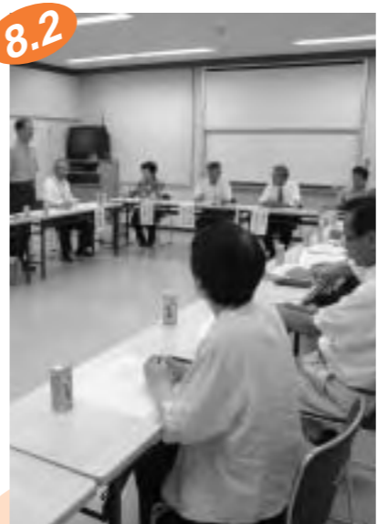
8.2 ▶まちへのこころを熱く意見

「婆娑羅まつり」11年目の挑戦 丸亀の夏を彩る「まるがめ婆娑羅まつり」が開かれました。幼稚園や保育所の子どもたち25チームによる「バサラ☆キッズ」や婆娑羅ダンス「風起」が6会場で舞を披露。5000発の色鮮やかな花火が城下町・丸亀の夜空を焦がしました。綱引き大会や書道パフォーマンス、B級グルメの出店など、趣向を凝らしたイベントも開かれ、見物客らは心の底から祭りを楽しんでいるようでした。