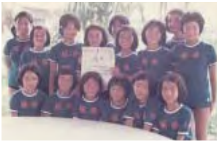
スポーツ大会で表彰(後列左から2人目)