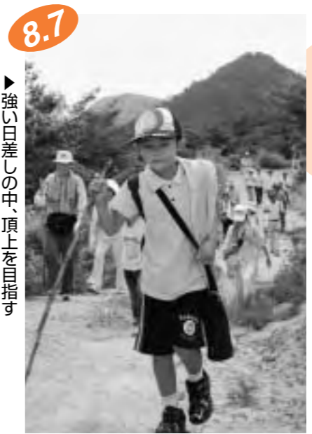
8.7 ▶強い日差しの中、頂上を目指す

市政に幅広い提言 小中学生のミニ議会 市内の小・中学生が1日議員になって、だれもが住みたくなくなる丸亀を考えたり、市政への提言などを市長・教育長と議論を交わしたりするミニ議会が開かれました。緊張感漂う中、1日議員らは「運動場の芝生化を」、「省エネ都市を目指すには？」などと堂々とした発言ぶり。市長らと、今後の市の発展を担っていく小・中学生との真剣な意見が交わされました。