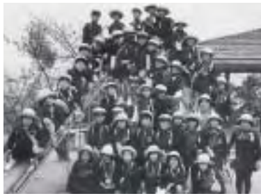
青ノ山の遠足(最前列右から2人目)

方の学習指導は徹底していて、児童たちの自主性をいつも尊重してくれた。当時流行っていた宝塚歌劇団の「ベルサイユのバラ」をまねて、友人たちと劇を作ったところ、先生方は快く体育館を開放し、集客に協力してくださいました。先生にも、友達にも何でも言える自由闊達さと家庭的なつながりがあった。 春は「お城まつり」、夏は「商店街の土曜デー」、秋は「丸高の文化祭」、冬は「お城のマラソン」を楽しみに一年が過ぎていった。いつもお城が見守ってくれた。いつもお城が胸に、子ども時代を過ごせたことを感謝している。 現在、夫の法律事務所を手伝う傍ら、子どもの問題や活動にかかわる毎日を過ごしている。城西小学校の「力をあわせてせいっぱい」の輝きを、今の子どもたちに伝えられたら、と願っている。