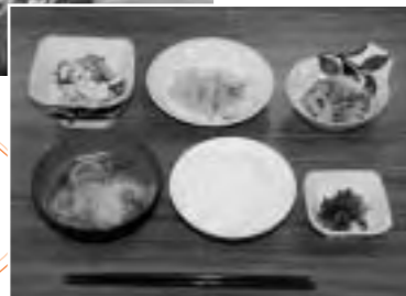
ゴーヤ尽くしの料理が並びます