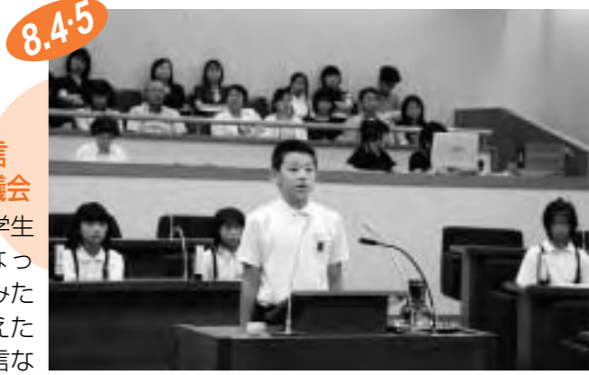
8.4・5 ▶市長・教育長にはきはりと提言

市政に幅広い提言 小中学生のミニ議会 市内の小・中学生が1日議員になって、だれもが住みたくなくなる丸亀を考えたり、市政への提言などを市長・教育長と議論を交わしたりするミニ議会が開かれました。緊張感漂う中、1日議員らは「運動場の芝生化を」、「省エネ都市を目指すには？」などと堂々とした発言ぶり。市長らと、今後の市の発展を担っていく小・中学生との真剣な意見が交わされました。