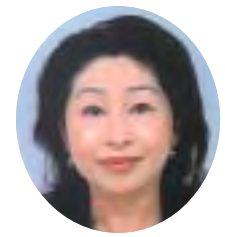
おもてまち法律事務所勤務。岡山市在住、中府町出身。

お城の緑が映える城西小学校は、わたしの学び舎であり、遊び場でもあった。当時、鉄筋3階建ての南校舎が完成し、続いて中庭にジャンボ花壇と噴水が出現した。OHPなる機器やカラーテレビも導入され、わたしたちははしやぎ回って、真っ白な校舎をぐるぐる歩いた。渡り廊下にある下駄箱で靴を履き替え、中庭に出て長くいおしゃべり。木造の古い家屋に住んでいたわたしにとって、緑あふれる中庭は、あこがれの場所だった。めまぐるしく変わっていく学校は、日々ワクワク感に満ちていた。 学校には、いつも新しい風が吹き、仮装行列や応援合戦などの出し物、新しい行事やクラブ活動が次々と誕生した。トランペット鼓隊も生まれ、カレーライス、米飯給食も登場した。選挙管理委員会を作って、大人同様の児童会選挙も行われた。 「よく学び、よく遊べ」。先生