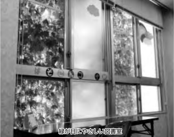
緑が目によさしい図書室

城坤コミュニティセンターの図書室は、昼間でも涼しく過ごせます。南側の大きな窓一面に、アサガオとゴーヤが茂り、「緑のカーテン」に覆われているからです。