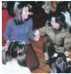
チェコスロバキアの子どもたちと

お城の緑が映える城西小学校は、わたしの学び舎であり、遊び場でもあった。当時、鉄筋3階建ての南校舎が完成し、続いて中庭にジャンボ花壇と噴水が出現した。OHPなる機器やカラーテレビも導入され、わたしたちははしやぎ回って、真っ白な校舎をぐるぐる歩いた。渡り廊下にある下駄箱で靴を履き替え、中庭に出て長くいおしゃべり。木造の古い家屋に住んでいたわたしにとって、緑あふれる中庭は、あこがれの場所だった。めまぐるしく変わっていく学校は、日々ワクワク感に満ちていた。 学校には、いつも新しい風が吹き、仮装行列や応援合戦などの出し物、新しい行事やクラブ活動が次々と誕生した。トランペット鼓隊も生まれ、カレーライス、米飯給食も登場した。選挙管理委員会を作って、大人同様の児童会選挙も行われた。 「よく学び、よく遊べ」。先生