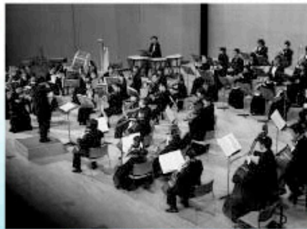
丸亀シティフィルハーモニックオーケストラ

【誕生記念コンサート】 と き：10月9日(日)・午後1時半開場、午後2時開演 と ころ：丸亀市民会館大ホール 入場料：小学生以上1,000円(乳幼児など就学前のお子さんの入場はご遠慮ください) 問い合わせ先：文化課 ☎8822