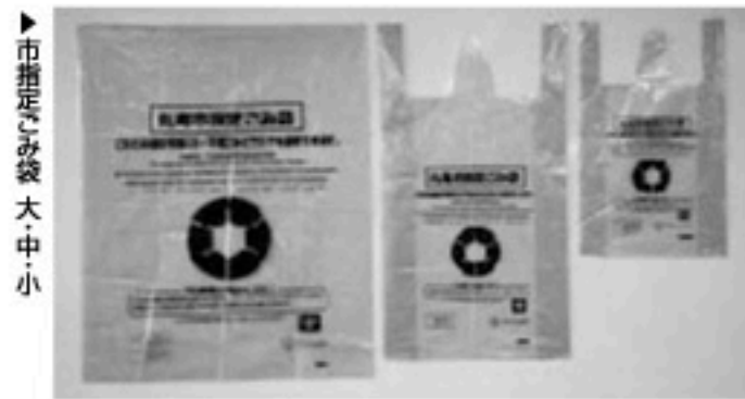
市指定ごみ袋 大・中・小

家庭から出る「可燃ごみ」と「不燃ごみ」は、十月から「丸亀市指定ごみ袋」で出してください。指定ごみ袋以外の袋で出された場合は収集できません。市民のみなさんのご理解とご協力をお願いします。