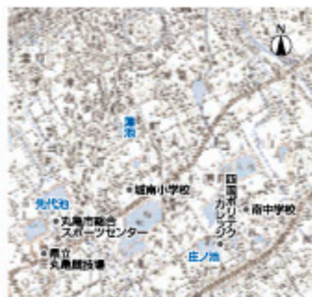
〔国土地理院発行5万分の1 地形図「丸亀」を約77%に縮小〕

「平野にあって、周りが堤防で囲まれている池(皿池)は、どこから水が入るの?」と、ため池のない県外の友人にたずねられたことがある。