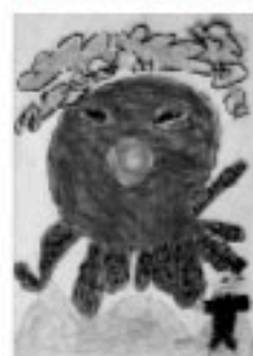
中央後援部 管我部 亮

TEL: 08841 FAX: 04073 e-mail: shomu-k@city.marugame.lg.jp