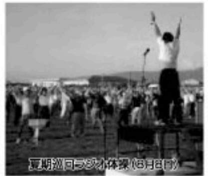
夏期湖沼清掃体験(8月1日)