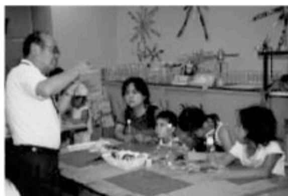
家族そろって工作に集中