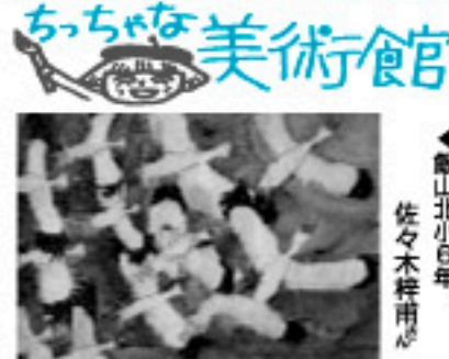
城原小6年 佐々木 梓用