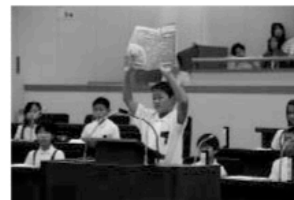
大きな声で発言する小学生議員