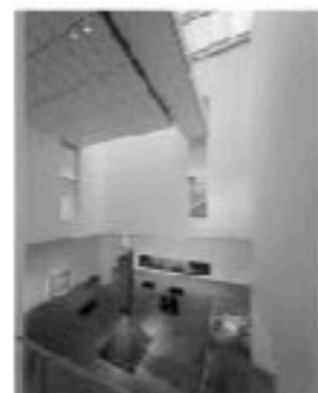
ニューヨーク近代美術館/2004