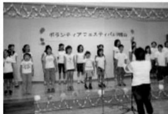
子どもたちの歌声が会場に響く