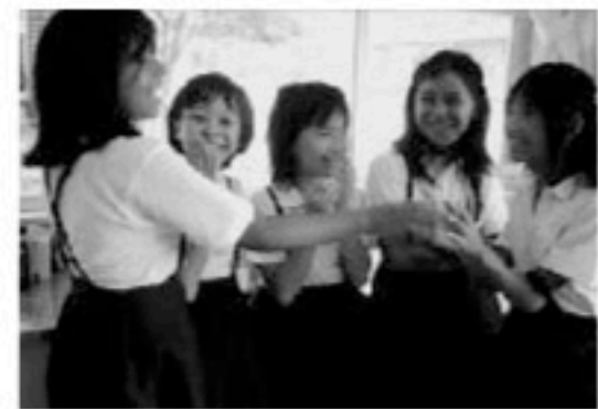
▲笑顔で会話も一層弾みます

四月、ベルギーの女の子二人が転校して来ました。それがきっかけで、世界の国と日本について調べる学習がスタートしました。まず、二人の生まれた国について調べました。その国を知ることで、二人と友達になれるかもしれないと思っただけです。二人にスペイン語のあいさつを教えようと思ったのですが、発音が難しかったです。しっかりとスペイン語を使っているように決めたので、次に、日本とかかわりの深いアメリカと中国について