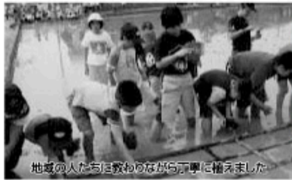
地域の人は教えながら丁寧に植えました