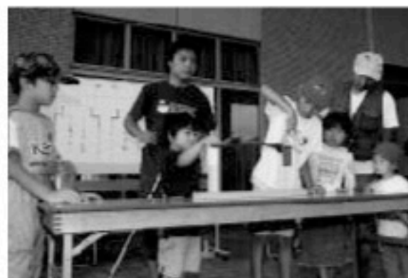
暑さを忘れ楽しみました

小学3・4年生の子どもと保護者に、地域の施設を知ってもらおうと、夏休み親子施設見学が開催されました。見学先の一つ、消防署では、この日緊急出動が相次ぎ、参加者は見学と同時にリアルな緊張感を体験。クリントピア丸亀では見学と工作があり、子どもと保護者が協力して作品を作っていました。