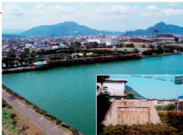
先代池を埋め立て建設されたスポーツセンター。右後方は県立丸亀競技場南中学校正門脇に建つ「太夫池跡地の碑」：写真右下