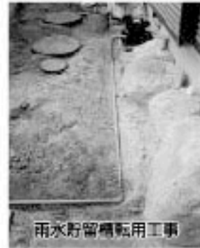
雨水貯留槽転用工事

●排水設備は指定店で 下水道へ接続する水洗便所改造工事や排水設備工事は、市が指定した工事店へ依頼してください。無届工事や指定工事店以外が施工したときは、市条例により罰せられます。