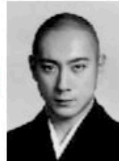
新之助改め 十一代目市川海老蔵

●とき=9月18日(日)・午後0時半 ●午後4時半 ●入場料=S席 7,000円ほか(全席指定席)