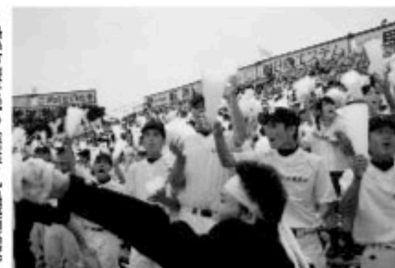
熱い言葉を交わす中、提言：丸亀城西高校

市内の小中学生が一日議員となって、市長・教育長などに提言するミニ議会が開かれました。夏休みを返上して出席した子どもたちは、合併後の丸亀市をよりよくするために考えた案や要望を披露。水不足の問題、市内全域をカバーする循環バスの必要性など、的を射た提言に市長などは感心しながら回答していました。