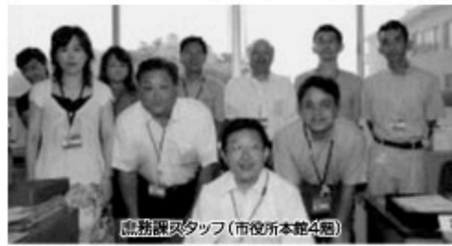
庶務課スタッフ(市役所本館4階)

庶務課では、条例や規則の審査・制定・改廃業務、公文書の管理業務、各種統計業務などを行うとともに、防災対策室を設け、防災および危機管理に関する業務を行っています。