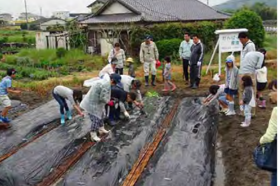
地域の人たちとサツマイモ植え

このような活動を通じて、企画運営をするには支援を必要としている側、支援をする側が一緒に進んでいくことが、大切だと気付かされました。子どもたちは地域の宝。子どもたちを楽しく安全に、地域ぐるみで育てる町を、さらに目指していきます。