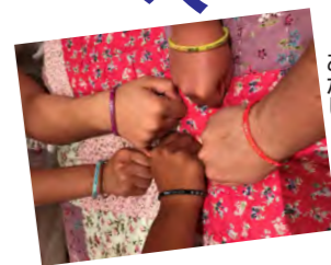
新しい家族のあかし