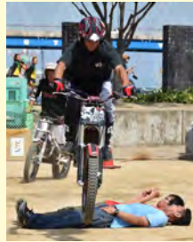
婆娑羅バイクトライアル