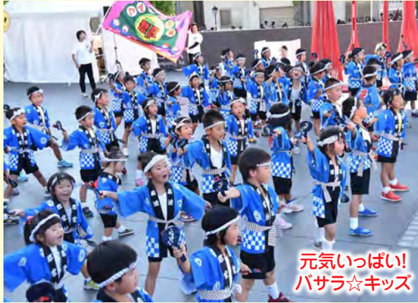
元気いっぱい! バサラ☆キッズ