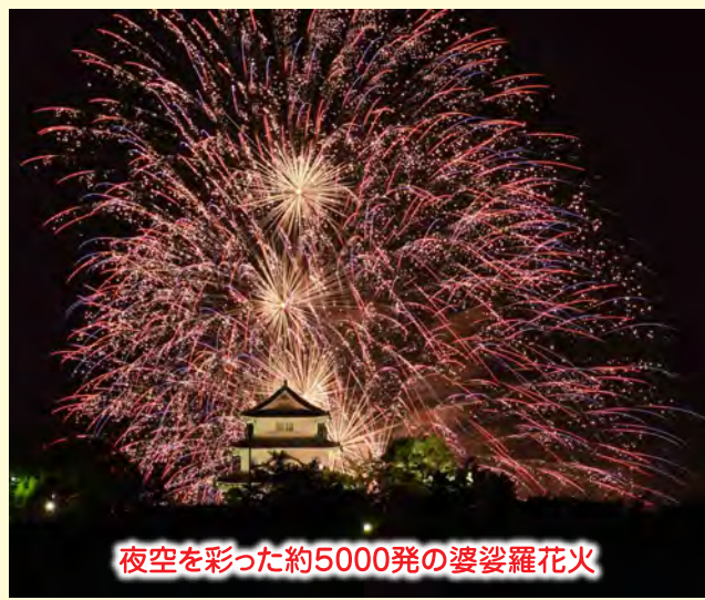
夜空を彩った約5000発の婆娑羅花火