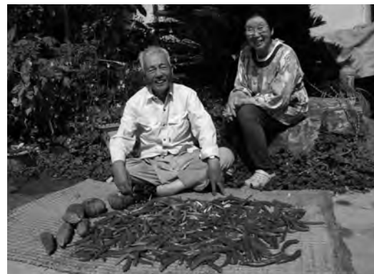
食は命と健康の源です

私は早くに親を病気で亡くし、農家の長男として生きてきました。日本の農業の厳しさは、全国的な農業離れや後継者不足に見られるように、産業としての魅力は少なく、年齢とともにその意欲もだんだん薄れています。今年私は80歳。家内は77歳。折りしも3年前の秋、家から車で10分の所に産直の「讚さん広場」がオープンしました。このことは、私たちの心の中で消えかけていた「農業への思い」に火を点けてくれたようです。妻と二人「よし、産直らしい物を出荷しよう」と相談した結果、トウガンや讚岐三白のサトウキビなどの昔からの野菜に加え、珍しい中国産の野菜など多種類の作物を取り入れ、周年