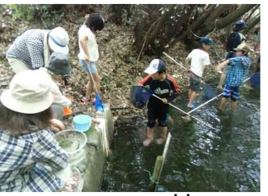
自然の中でわんぱく楽校

また、小学校では、先生方とよく話し合って、低学年生が黒板に届くようにと踏み台作り、合唱の時のひな壇作り、運動会での白線引き、学校に慣れていない新一年生の教室での「スタートボランティア」(学習指導補助)を行っています。さらに、自然の中で体験学習をする「わんぱく楽校」、「子ども防災教室」、「子ども料理教室」などいろいろ子育て支援活動をしています。