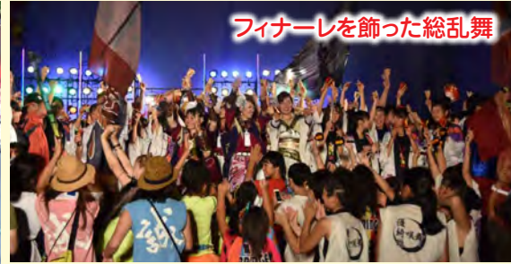
フィナーレを飾った総乱舞

晴天に恵まれた今年は、バサラ☆キッズや婆娑羅ダンス「風起」の踊り子ら延べ約6500人が華麗で力強いダンスを披露し、2日間で約17万8000人の人手でにぎわいました。