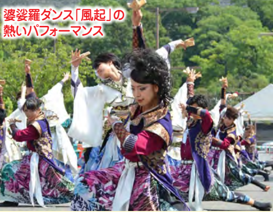
婆娑羅ダンス「風起」の 熱いパフォーマンス

TEL23-2111(代) ホームページhttp://www.city.marugame.lg.jp