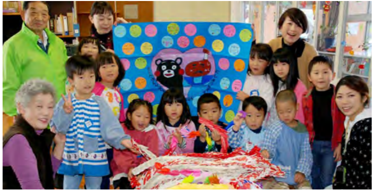
「くまもんもがんばって!」

に移すことが難しいなか、このお話は、子どもたちにとって良いチャンスとしました。城北幼稚園と西幼稚園の年長児36人と先生たちが、一人一羽ずつ折った鶴50羽にメッセージを添えて、地域の人たちが折った千羽鶴3000羽と一緒に送っていただきました。