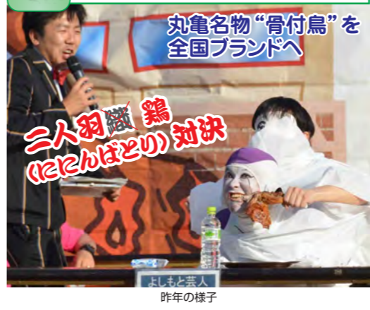
丸亀名物“骨付鳥”を全国ブランドへ