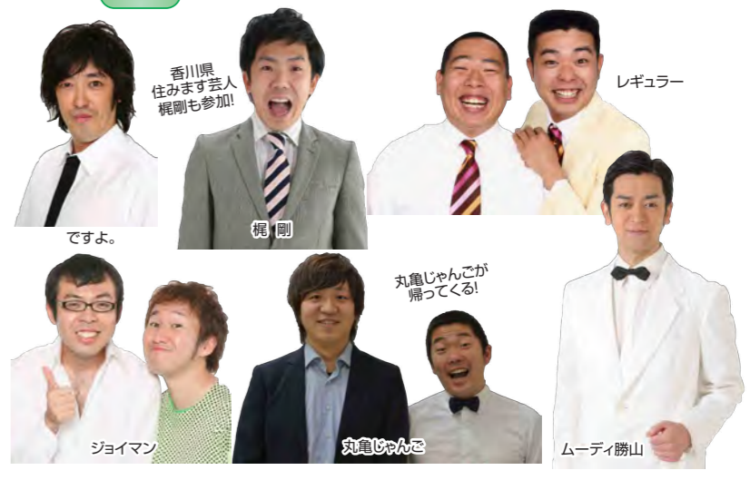
よしもと一発屋芸人お笑いステージ