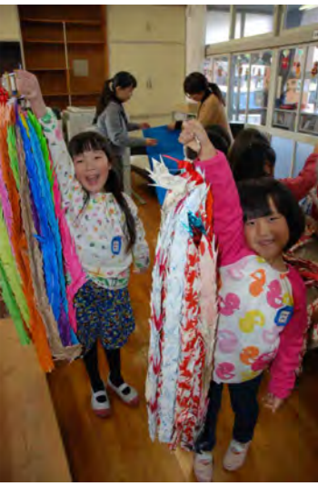
私たちが折りました